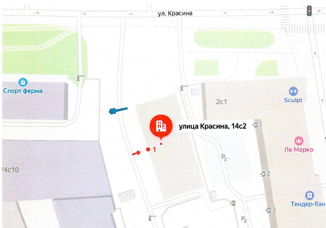
Схема установки ограждающего устройства (1-го шлагбаума) на придомовой территории муниципального округа Пресненский по адресу: Красина ул., д. 14, с.2

к решению Совета депутатов муниципального округа Пресненский от 13.03.2024 № 24.10.265